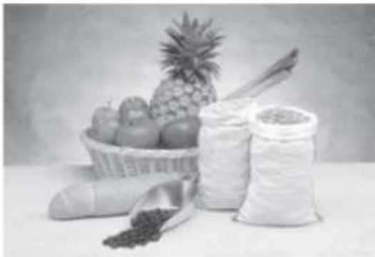
Algunos alimentos ricos en fibra.

Los alimentos más ricos en fibra son las legumbres, los cereales, las frutas y las verduras. La dieta mediterránea incluye todos ellos.