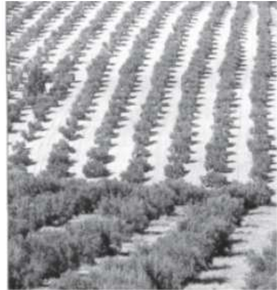
Olivar en Cazorla (Jaén). El aceite de oliva es un componente fundamental de la dieta mediterránea.

Diversos estudios han demostrado que esta dieta es la más saludable porque es equilibrada, no tiene exceso de grasas, e incluye vitaminas y fibra. A la composición de la dieta se une otra ventaja: la forma de cocinar los alimentos.