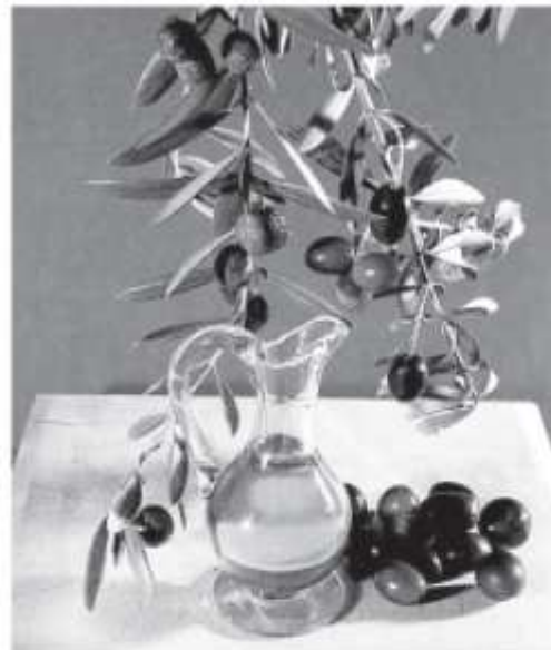
El aceite de oliva se obtiene mediante el prensado de las aceitunas. La calidad del aceite depende de la variedad de aceitunas que se utilice en su elaboración.

Además, consumido crudo, como, por ejemplo, en ensaladas, ayuda a controlar el nivel de colesterol en la sangre. El colesterol es un tipo de grasa que, si se acumula en los vasos sanguíneos, produce trastornos circulatorios.